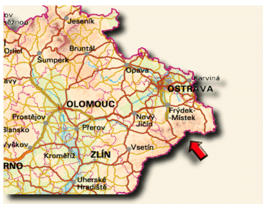
Obrázek: Region Severní Morava